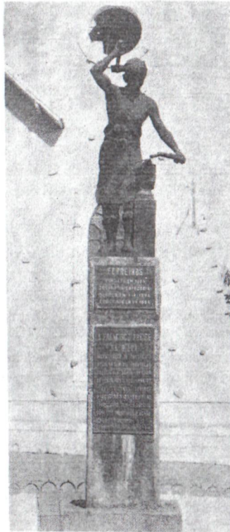
Estátua-símbolo do Município, inaugurada em 1º de janeiro de 1969. Ferreiros foi fundado em 1986, elevado à categoria de Vila em 1º de janeiro de 1954 e de cidade em 1º de janeiro de 1964 pelo então Governador de Pernambuco, Dr. Miguel Arraes de Alencar.